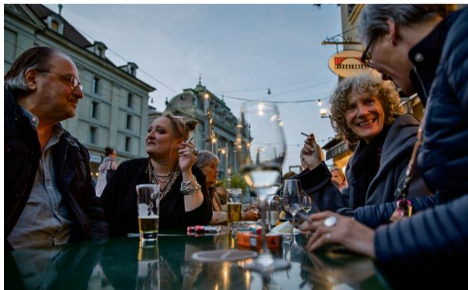
Montag bis Freitag: Die 49-Jährige geht nur unter der Woche aus. Derzeit am liebsten ins «Pyri».

Während sie die Abende nutzt, um unter Leute zu kommen, arbeitet sie tagsüber als Grafikerin: Nebst ihrer Stelle als Layouterin bei der Beilagenredaktion von «Bund» und BZ arbeitet sie selbstständig daheim im Kirchenfeldquartier. Konsequenter geht sie zwischen Montag und Freitag aus, aber nicht mehr jeden Abend, das schaffe sie in ihrem Alter nicht mehr. Unter der Woche treffe man die Berner Kulturprominenz, die am Wochenende oft Engagements habe.